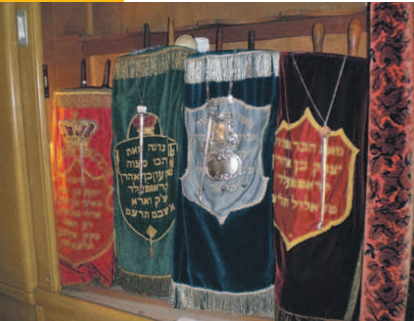
Thora-rollen in de Ark van de synagoge in Aalten

De Tien Geboden maken deel uit van het geheel, dat geheel, waarvan Jezus zegt dat Hij niet gekomen is om het te ontbinden maar te vervullen