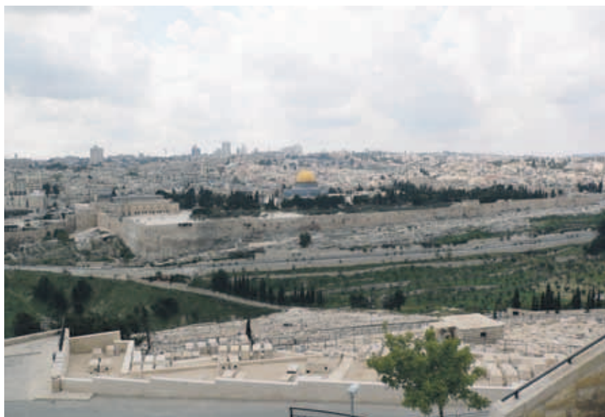
Jeruzalem, Sion, vanaf de Olijfberg

Waar hebben we het dan precies over als het gaat over ‘christenzionisme’?