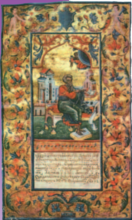
Fraaie uitgave van 1Thessalonicenzen waarin een scherpe uitspraak van Paulus staat over de Joden

Helaas zijn deze teksten de eeuwen door misbruikt om de Joden te haten en te vervolgen. Juist ook in de kerk. Wij mogen dit de Nieuwtestamentische schrijvers niet verwijten. Wel moet de uitwerking van deze teksten kritisch worden onderzocht. In dit opzicht moeten we tegen hen preken. Teksten als Lucas 23:39-42; Handelingen 2:39-42; Romeinen 9-11 en Efeze 2:11-3:8 laten zien: God heeft Zijn volk niet verstoten en de volken mogen delen in Zijn heil in Christus.