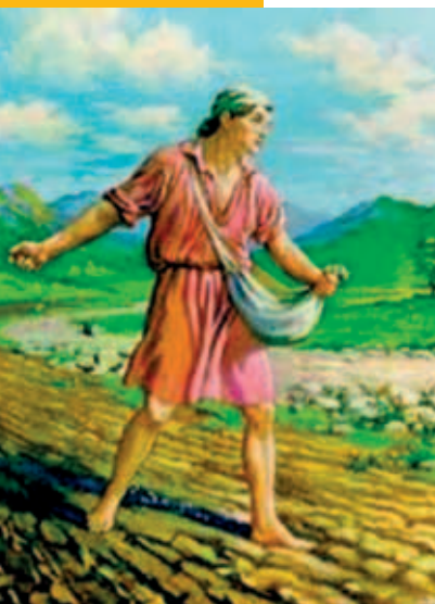
De zaaier die het zaad draagt

Wenden we ons tot modernere commentaren, dan komen we daarin de gedachte tegen dat het mogelijk is dat de verzen 5 en 6 van Psalm 126 herinneringen bevatten aan een ritueel wenen bij het zaaïen, wat overeenkomt met een rituele vreugde bij de oogst. Volgens een andere verklaarder lijkt vers 5 een spreekwoord of een spreuk te zijn. Weer een ander vat de verzen 5 en 6 figuurlijk op. Zij geven aan dat er een tijd zal liggen tussen dit wenen en juichen en dat er tegelijk een innerlijke samenhang is, zoals die er ook is tussen zaaïen en oogsten. Weer een ander ziet vers 5 en 6 als een beeld dat ons