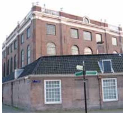
De Portugese Synagoge te Amsterdam

Genesis 12:1-9 met de daarbij behorende haftarah of profetenlezing uitgelegd vanuit de Joodse traditie. (Verkorte weergave van een lezing die door rabbijn L. v.d. Kamp gegeven werd voor Deputaten Kerk en Israël)