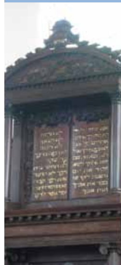
De Tien Woorden boven de Ark in de Portugese Synagoge

Wat is nu precies de zegen die de wereld krijgt vanuit het Joodse volk? De wereld zal de almacht van God erkennen