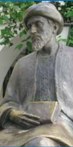
Het standbeeld van Maimonides te Cordoba

Gen. 12:3 verwijst niet naar de komst van de Messias. Het gaat erom dat de volken komen tot de erkenning van de Eeuwige