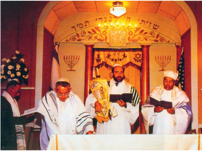
Het bidden van het Kol-Nidré, het gebed dat Grote Verzoendag inluidt