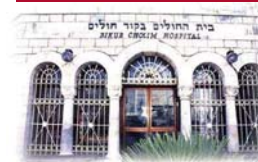
Het Bikoer Choliem ziekenhuis in het centrum van Jeruzalem

De gerichtheid op het leven komt sterk naar voren in het positieve gebod van 'ziekenbezoek' ( bikoer choliem ). Daarin volgt men God na, die Abraham bezocht nadat hij besneden was (Gen. 18:1). Hoe hoog het nalaten van een bezoek aan een zieke wordt opgenomen, horen we uit de woorden van Rabbi Akiba: Een ieder die een zieke niet bezoekt: Het is alsof hij bloedvergiet. (b. Nadariem 40a). Ziekenbezoek en de verzorging van een zieke worden als geweldige daden van naastenliefde gezien.