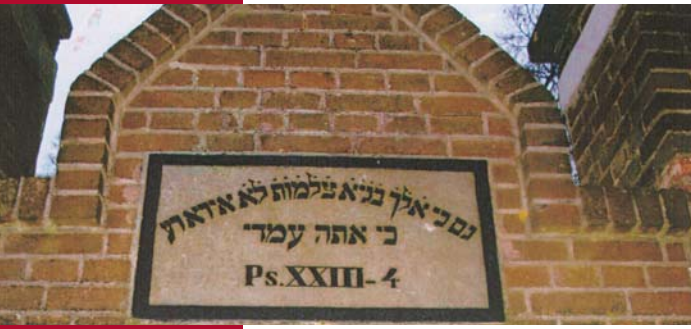
De tekst van Psalm 23:4 boven de toegangspoort van joodse begraafplaats te Elburg

Het lichaam moet rein aan God worden teruggegeven, zoals ook de ziel zijn reinheid moet herkrifgen