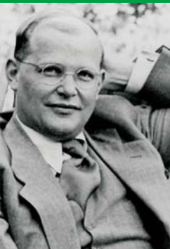
Dietrich Bonhoeffer de absolute tegenhanger van Grundmann

Hebben velen niet onbewust een beeld van Jezus dat vergelijkbaar is met het beeld dat Grundmann oproept: Jezus als verkaar tegenstander van de Joodse godsdienst?