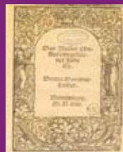
Titelblad van het Jodenvriendelijk boek van Luther

in ziet, voor eeuwig niet.' Hij scherpt het nog aan met de woorden: 'Hun synagogen moet men in brand steken