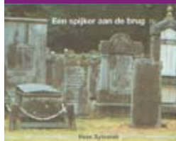
Een spijker aan de brug

Begraafplaatsen staan bij Joden in veel hoger aanzien dan bij christenen. Je kunt christen worden door een