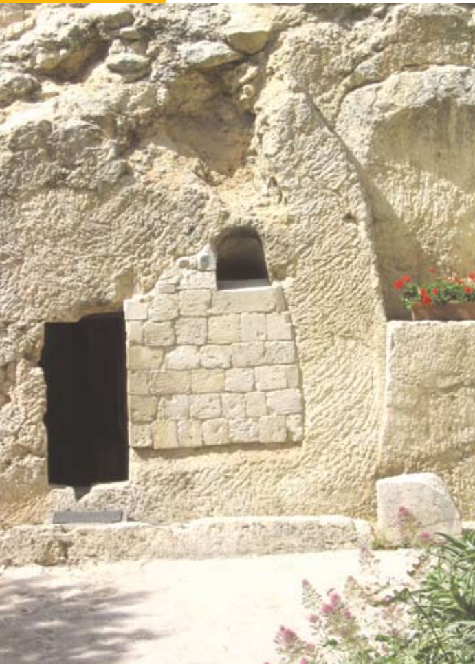
Graftuin met het geopende graf: teken van de hoop van Israël

die collecte opgezet en we mogen er dus vanuit gaan dat Paulus in iedere gemeente daarover gesproken heeft. En er werd ook op gereageerd: Macedonië doet mee, Korinte geeft. In het brengen van de gaven vanuit de volken naar Jeruzalem zou iets te zien zijn van dank van de volken voor het heil dat uit de Joden gekomen is (vgl. Rom.15:26v.). Ook die collecte is dus door en door eschatologisch geladen. Opnieuw noteer ik: De hoop van Israël is bezig vervuld te worden!