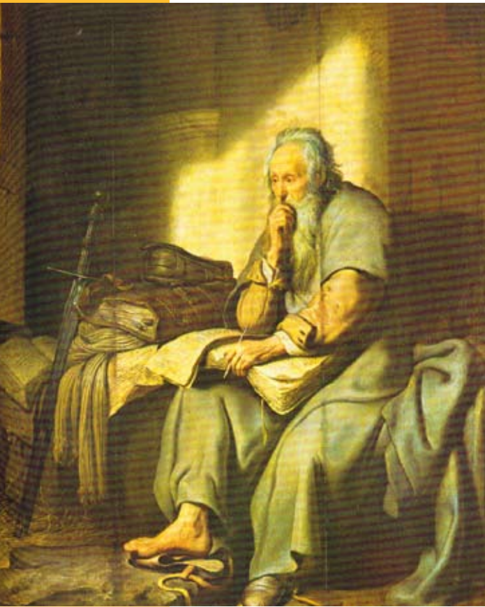
Rembrandt: Paulus in gevangenschap (Hand. 24:27)

de HERE. Immers de vervulling in Christus betekent niet dat de beloften hebben afgedaan, maar integendeel verhevigd zijn en dat het wachten op het definitief openbaar komen van wat reeds vervuld is, een des te grotere spanning en verwachting uitwerkt. Stempelt de hoop op de beloften aan de vaders gedaan ons leven? Niet vanuit de gedachte dat onze bijdrage het verwachte nabij brengt, maar wel in de wetenschap dat de HERE onze werken in zijn dienst wil nemen. Als Paulus er in zijn brieven over spreekt dat de taak voor de kerk is Israël tot jaloersheid te brengen, dan zal dat