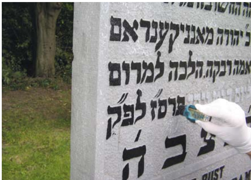
Letters zwart maken

Maar vooral de dank die de joodse gemeenschap voor dit werk heeft is van onschatbare waarde