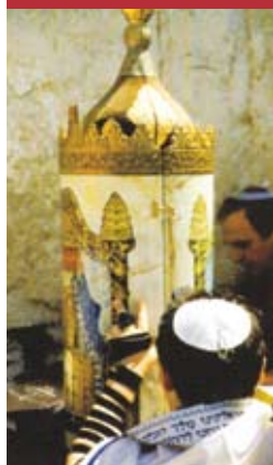
Halacha komt o.a. voort uit Tora

De bijbelse basis voor de halacha kan in Leviticus 19 gevonden worden. Daarin geeft God aan dat Hij, omdat Hij een heilig God is, ook een heilig volk wil hebben. Om daadwerkelijk een geheiligd volk te zijn, worden de regels in