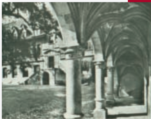
College van Calvijn

D eenheid van de Schrift komt door deze manier van denken opnieuw onder druk te staan.