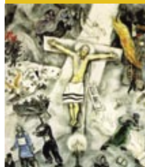
Chagall: witte kruisiging

Psalm 22 volgt op twee koningspsalmen (20 en 21). Daarin staat de bescherming van de koning en zijn verhoring door God centraal (Ps. 20:2, 3, 7, 10 en 21:2, 3, 5). In veel opzichten vormt Psalm 22 daar een contrast mee. Wat gebeurt er als God zijn koning nu eens niet antwoordt (Ps. 22:2, 3)? Alledrie deze psalmen zijn bovendien “van David”. Het is goed mogelijk dat voor latere auteurs zoals de evange-