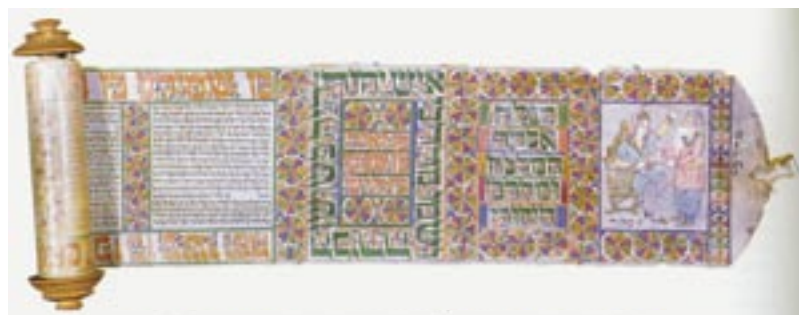
Een prachtige 18 e eeuwse Perzische rol van Esther

Met het reciteren van deze psalm zou ieder individu de vurige bede tot G'd moeten richten om een definitief einde te maken aan deze pijnlijk lange ballingschap.