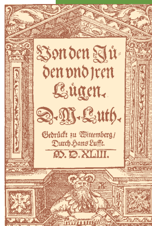
Titelblad van het geschrift van Maarten Luther: Van de Joden en hun leugens.

Alléén de Here – dat is het genadige; maar ook het aanstotelijke: het haalt een kruis door alles wat 'hoog van gevoelen'