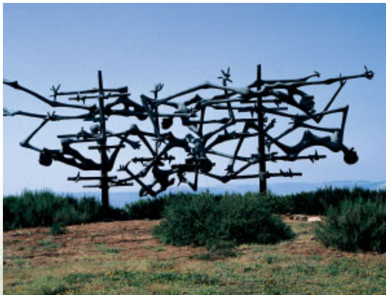
Herinnering aan de concentratiekampen. Monument in Yad waShem.

Ondubbelzinnig lees ik hier de krachtige belofte voor Israël van terugkeer, herstel en wonen in het land