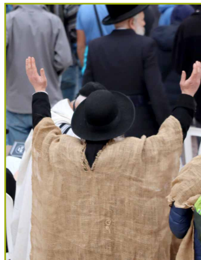
Man gehuld in een zak bij de Klaagmuur, tijdens de dag die herinnert aan het vasten van Esther

'Dat vind ik moeilijk in te schatten. Persoonlijk vind ik het nog lastig hierover gesprekken te voeren. Dat komt