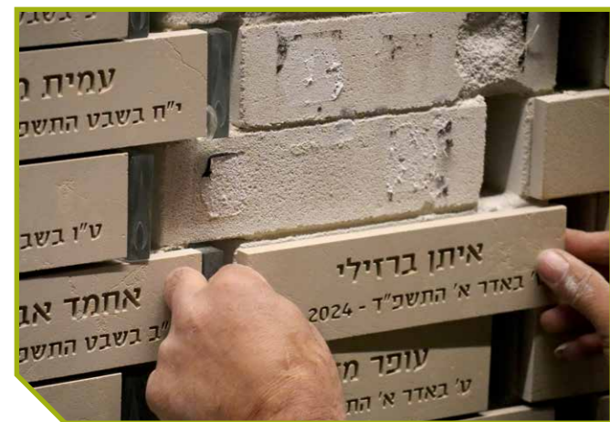
Nieuwe steen voor een recent gesneuvelde militair in de Hall of Remembrance

'Kort na het uitbreken van de oorlog was op een bepaald moment al het brood in de supermarkt op. Het gebed om dagelijks brood wordt dan heel concreet voor je. Na de eerste twee onrustige weken aan het begin van de oorlog hebben we ongeveer eens in de twee weken alarm gehad, vanaf half december was dat voorbij. In Jeruzalem merk je heel weinig meer van de oorlogsomstandigheden. Je ziet wel veel mensen met een wapen bij zich, voor het geval dat er een aanslag plaats zou vinden. Gelukkig is ons veiligheidsgevoel altijd goed geweest.