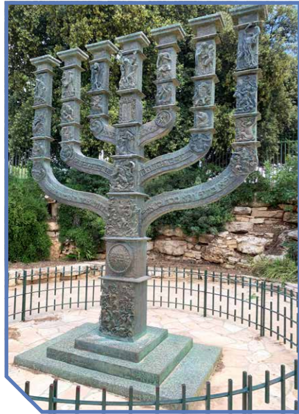
Bij de foto op de voorpagina:

De menorah bij de Knesset, volgens een inscriptie 'een symbool van het licht van geloof en hoop, dat het Joodse volk 4000 jaar geleid heeft (...) in hun missie de godsdienst van de gerechtigheid overeind te houden onder mensen en te midden van volkeren'.