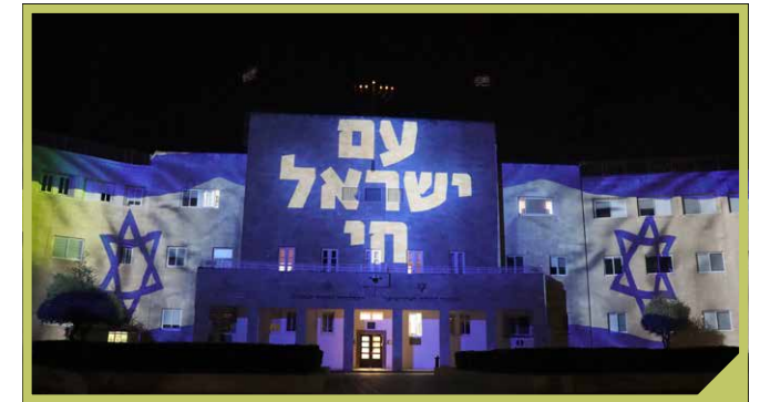
'Am Jisrael Chai': het volk Israël leeft

Aan de andere kant van het brede spectrum van visies op Israël roepen er mensen (waaronder Palestijnse christenen) dat er een genocide gepleegd wordt. En laten we eerlijk zijn, de dodenaantallen uit Gaza zijn ook verschrikkelijk. De meer genuanceerde mensen hier in Israël weten dat en vinden dat ook verschrikkelijk. Tegelijk zijn het wel dodenaantallen die door Hamas gecommuniceerd worden. Het verschil tussen een onschuldige burger en een als burger geklede terrorist is niet