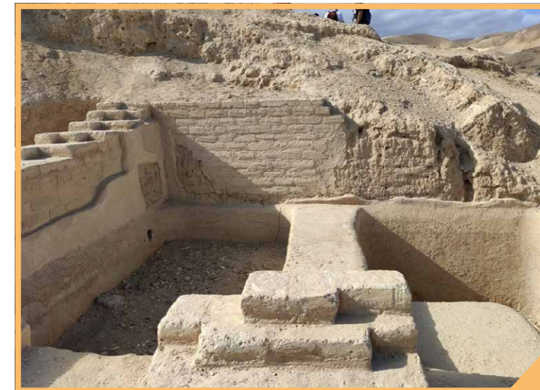
Een mikweh, een ritueel bad, uit de Hasmonese tijd

De dooppraktijk op zich was dus bij de discipelen bekend en zij zetten die voort. Maar Christus gaf hun een formule die voortaan bij de doop moest worden gebruikt. Dat is de specifieke invulling van de doop voor christenen. Het is de doopformule die terecht katholiek-christelijk is geworden: