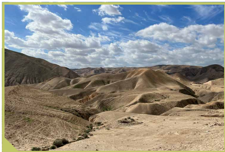
De Woestijn van Judea