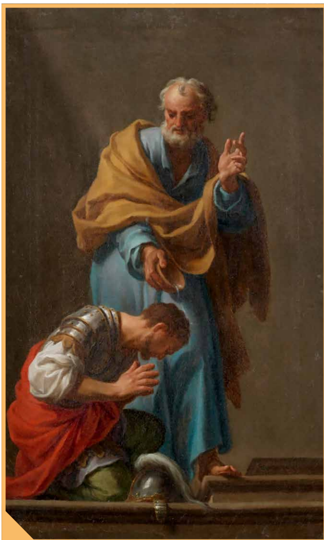
Paulus doopt een centurion

Heeft de Heere Jezus niet gewoon iets heel nieuws bedacht en gegeven? Of, de andere mogelijkheid: heeft Hij de doop gegeven in de plaats van iets dat eerder al bestond maar nu zou vervallen of vervangen zou zijn, concreet: dat de besnijdenis vervangen werd door de doop? Uit de woorden van Jezus is niet af te leiden dat Hij die doop instelde als vervanging van de besnijdenis. Het is goed om ons te realiseren dat er al een dooppraktijk bestond in de tijd van Jezus. Net zoals het avondmaal niet uit het niets ons door Christus werd gegeven, zo ook niet de doop.