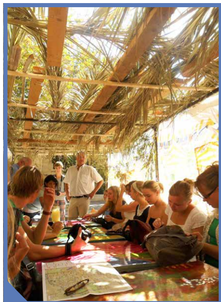
Bij de foto op de voorpagina:

Direct na Grote Verzoendag gaat men zich in Israël voorbereiden op het Loofhuttenfeest. Men bouwt een loofhut als teken dat men onderweg naar het beloofde land in tenten en hutjes gewoond heeft. Het Loofhuttenfeest vertelt ons dat we na inkeer en verzoening de weg van een leven met God weer mogen opnemen. Een leven naar Gods wil. De Thora krijgt de functie terug waartoe hij gegeven is. Het wordt een regel der dankbaarheid. Het 'heilig zult ge zijn, want Ik, de Here, uw God ben heilig' (Lev. 19 : 2), mag weer in praktijk gebracht worden. Het leven wordt en mag zijn: Leven in dankbaarheid.