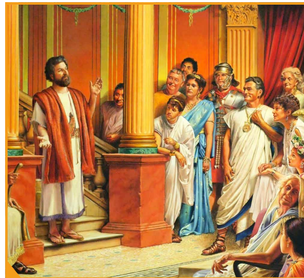
Petrus in gesprek met Cornelius

die uitdrukking lijkt hij Caesarea daar dus niet direct bij in te sluiten. De uitspraak van Petrus wordt gedaan in een heidens huis, wat voor Petrus een groter punt lijkt te zijn dan het feit dat hij in een overwegend heidense stad verkeert (vers 28).