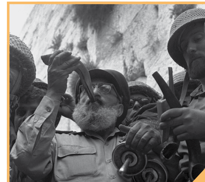
Legerrabbin Shlomo Goren blaast de sjofar als de Westelijke Muur is bereikt.

zingen, maar de meesten maakten daar geen gebruik van. Ze hebben ook recht op de Israëlische sociale voorzieningen.