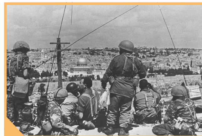
De brigade van Motta Gur (linksmidden, zonder helm) op de Olijfberg voor de aanval op de Oude Stad.

Israël trok zich pas terug uit de Sinaïwoestijn na in 1979 een vredesakkoord met Egypte te hebben gesloten. In 1994 tekenden Israël en Jordanië een vredesverdrag. De Westoever ging niet terug naar dat land, want koning Hoessein had in 1988 dit gebied opgegeven. De vorst wilde dat de Palestijnen daar een eigen staat zouden krijgen. Herhaaldelijke pogingen om een veelomvattend vredesakkoord met de Palestijnen te sluiten, strandden. Ook pogingen met Syrië om een akkoord te bereiken, mislukten. De bereidheid land op te geven, gold niet voor Jeruzalem. Israël wilde de stad onder controle houden en uitbreiden. Het kabinet en de Knesset keurden eind juni 1967 de expansie van de hoofdstad goed. Israël bouwde grote nieuwe Joodse woonwijken in de nieuwe delen van Jeruzalem. De bouw van nieuwe huizen voor Palestijnen bleef intussen achter. Palestijnen kregen een Israëlische identiteitskaart. Dat gaf hun de kans mee te doen aan gemeenteraadsverkie-