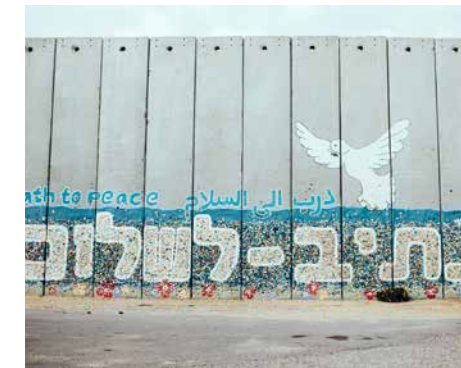
'De weg naar vrede' in het Engels, Arabisch en Hebreeuws op een muur nabij de Gazastrook

Het is, voor zover ik weet, voor het eerst dat we namens de SSMJ iets schrijven in