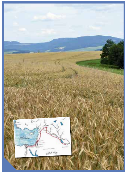
Bij de foto op de voorpagina:

Op de voorpagina een landbouwgebied in Israël, rijp voor de oogst. Ingezet een kaartje met de vermoedelijke route die Abraham, de vader van alle gelovigen, gevolgd heeft vanuit Ur der Chaldeeën.