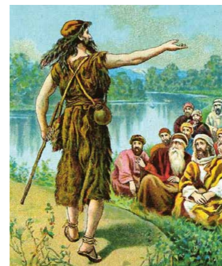
Johannes de Doper

Zowel in het Lukasevangelie als in Handelingen zien mensen uit naar het herstel van het koningschap van David. Een van de Emmaüsgangers vertelt aan de Vreemdeling die met hen meeloopt over Jezus 'Die een Profeet was, machtig in werken en woorden voor God en heel het volk; en hoe onze overpriesters en leiders Hem overgeleverd hebben om Hem ter dood te veroordelen, en Hem gekruisigd hebben. En wij hoopten dat Hij het was Die Israël