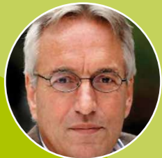
De theoloog en schrijver Andries Knevel is als radio- en televisiepresentator werkzaam bij de Evangelische Omroep

En nu komt voor ons de tijd van advent dichterbij. Zou ‘mussar’ ons ook niet kunnen helpen om antwoord te geven op die vraag van het lied: hoe zal ik U ontvangen, hoe wilt Gij zijn ontmoet? In de vier weken van advent kunnen de vier thema’s van deze cursus ons van dienst zijn om toegewijd naar Hem te gaan die in Bethlehem ter wereld kwam om de Messias van Israël en de Redder van de volken te zijn. Advent: tijd om even een stap opzij te zetten om je gedrag en je intenties te spiegelen aan wat God ons in de komst van Jezus Christus geeft. <