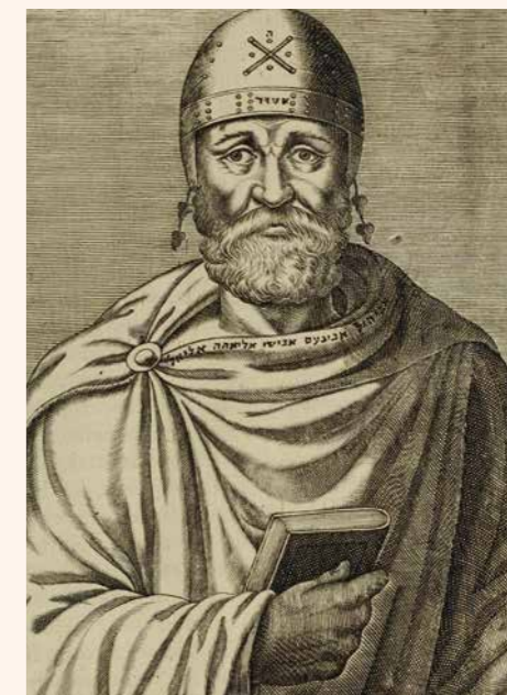
De Joodse schrijver Philo

Een deur om te spreken over Hem voor wie de 'kroon van doornen' gevlochten werd