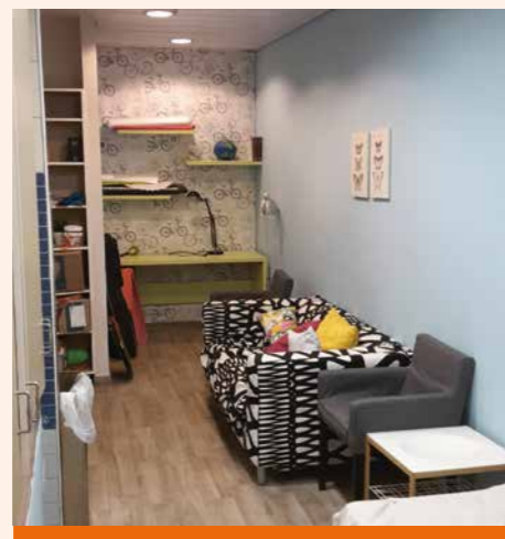
Appartement voor een leerling

Het Independence Project is ontwikkeld om de leerlingen meer kansen te geven op de arbeidsmarkt. In hun laatste schooljaar ontvangen zij een externe werkplek met begeleiding op de werkvloer, aangevuld met werkbezoeken en video-coaching door de docenten van Keshet High School . Zo kan zoveel mogelijk geoefend worden in een normale werksituatie. Deputaten Diaconaat en de GZB hebben de krachten gebundeld om dit project in september van start te laten gaan. Met hun steun is het mogelijk gemaakt dat voor de eerste vijf leerlingen een werkplek is gevonden en de bijpassende extra begeleiding bekostigd kan worden. De dankbaarheid binnen de school is groot. De coördinator van het project verwoordde het als volgt: ‘Uit de grond van ons hart willen wij u bedanken voor uw steun voor dit programma. U kunt zich nauwelijks indenken hoeveel kansen dit programma biedt aan onze studenten om te groeien op hun weg naar volwassenheid en zelfstandigheid.’