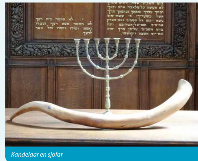
Kandelaar en sjofar

Haak is glashelder. Zijn visie ook. Vrijhof is minder helder. Dat heeft te maken met de baaierd aan opinies, en misschien toch ook met het feit dat Paulus over een mysterie spreekt? Een streep kan ik begrijpen, een mysterie is lastiger. <