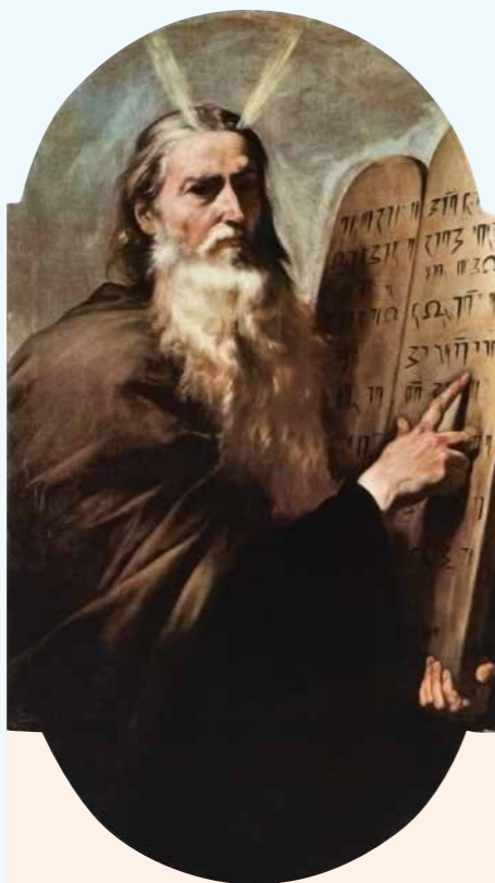
Mozes en de wet

In Exodus 19:6 wordt het volk Israël een 'koninkrijk van priesters' genoemd. Een eretitel, want welk ander volk kreeg deze naam van God? Maar behalve een eretitel is het ook een 'werktitel' die wijst op de speciale positie en taak die Israël krijgt. In dit artikel beschrijven we eerst wat die taak is en hoe die gestalte moest krijgen. Vervolgens letten we op de uitleg die vanuit de oude Joodse traditie tot ons komt.