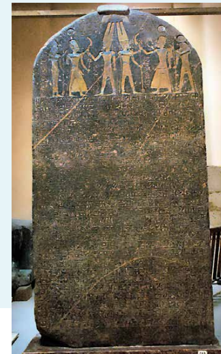
De Merneptah-Israël-stèle in het Egyptisch Museum te Caïro