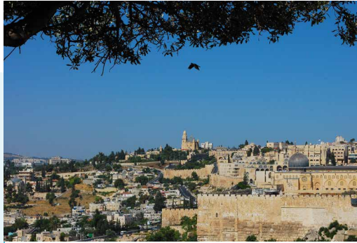
Jeruzalem, zicht op de Sionsberg vanaf de Olijfberg