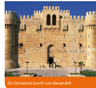
De Ossemanse burch van Alexandrië

De positieve houding van Origenes t.o.v. de Joden heeft nog met iets anders te ma-