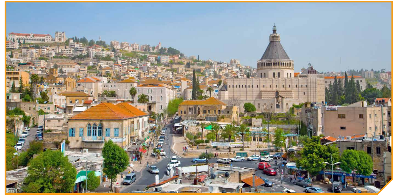
Het huidige Nazareth

Rachel overleed tijdens de geboorte van Benjamin en werd begraven ergens langs de weg naar Efrath (Gen. 35:19). In Jeremia 31 wordt ze gepresenteerd als moeder van het volk, die ontroostbaar is omdat haar kinderen haar zijn afgenomen, weggevoerd in ballingschap.