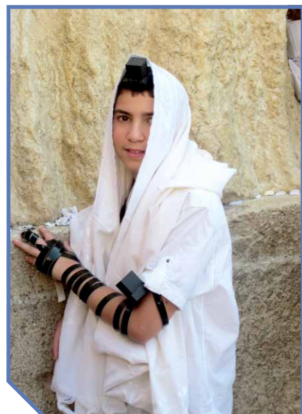
Bij de foto op de voorpagina:

Een van de belangrijkste fasen uit de levensgeschiedenis van een jood is het worden van Bar Mitswa, zoon der wet. Hij neemt dan de last van de Thora en van alle plichten op zich. Hij wordt dan als gelijkwaardig lid, met alle rechten en plichten, in de joodse gemeente opgenomen. Een jongen wordt een Bar Mitswa op 13-jarige leeftijd, een meisje een Bat Mitswa op 12-jarige leeftijd. Op de foto een zoon der wet bij de Klaagmuur in Jeruzalem