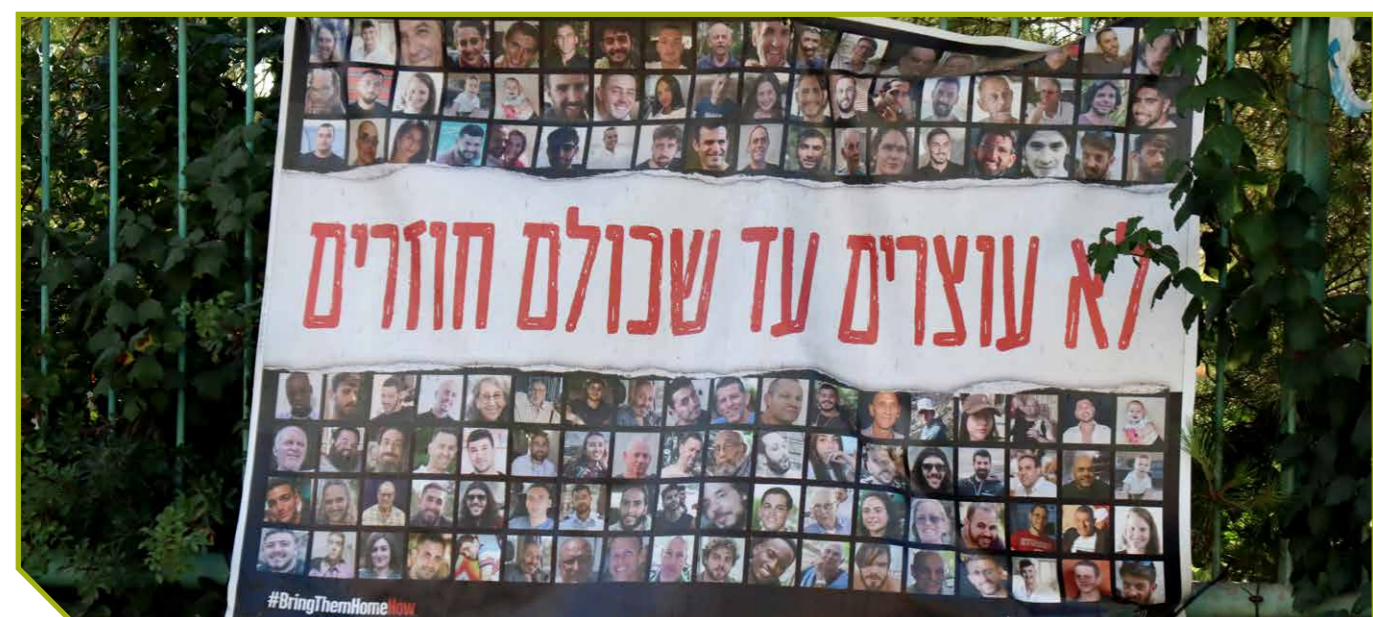
Poster met foto's van gegijzelden.

Op één van de bijeenkomsten van de 'Jerusalem Rainbow Group', een Joods-christelijke dialooggroep die al bestaat