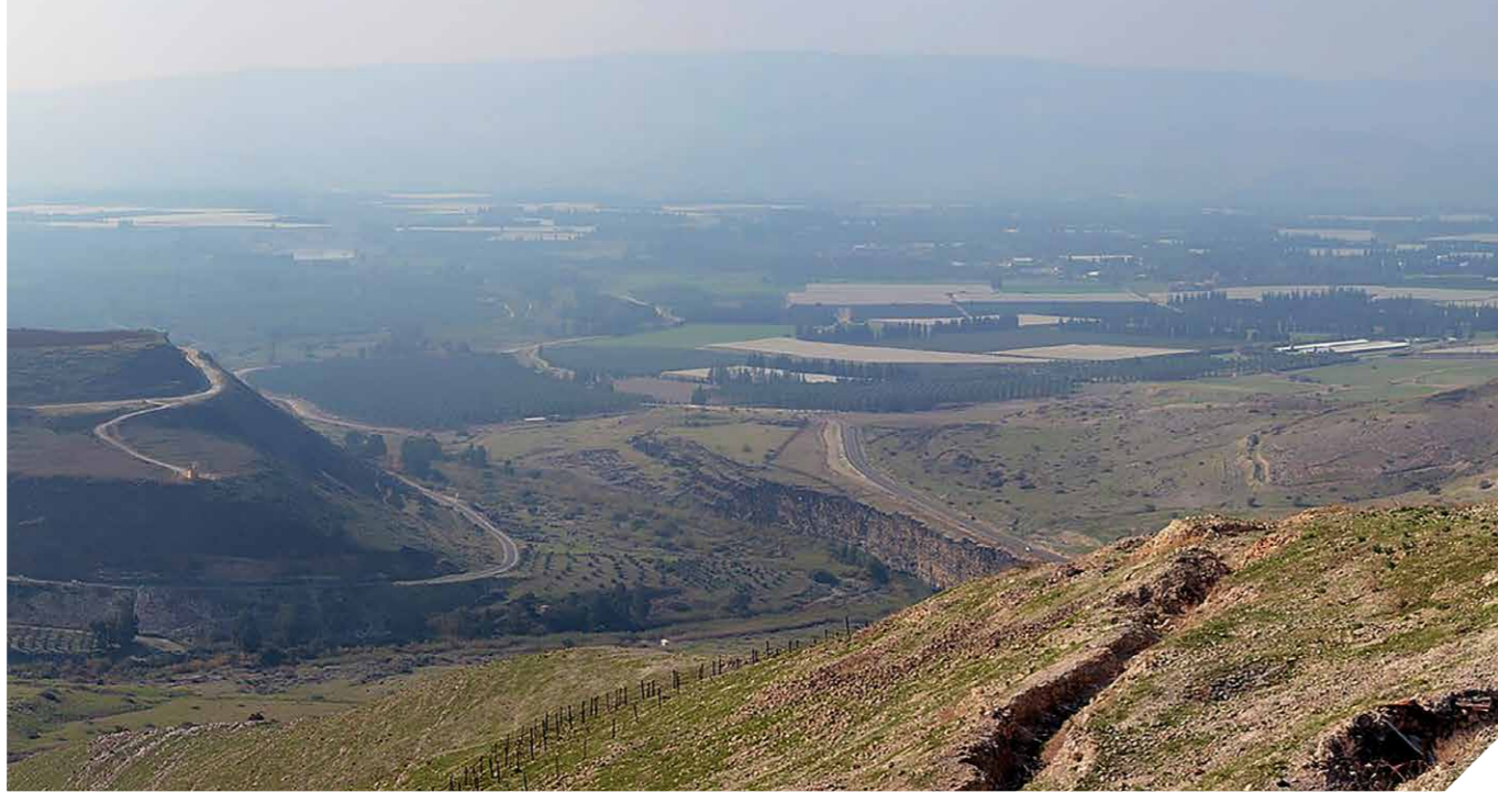
De Jordaanvallei (Wikimedia)